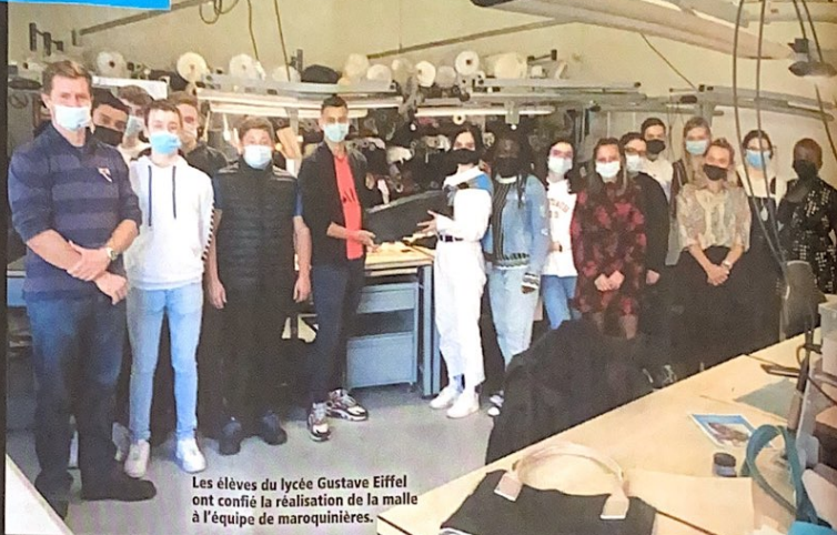
Les élèves du lycée Gustave Eiffel ont confié la réalisation de la malle à l'équipe de maroquinières.

Voici le dernier article à propos du projet de remise en état de deux BMW Série 2 de la gendarmerie de Fontainebleau (77). Il est écrit par les jeunes filles de Terminale métier du cuir et de la maroquinerie (TMCM) du lycée Flora Tristan de Montereau-Fault-Yonne, partenaire du projet et chargée de la refabrication d'une malle porte-radio.