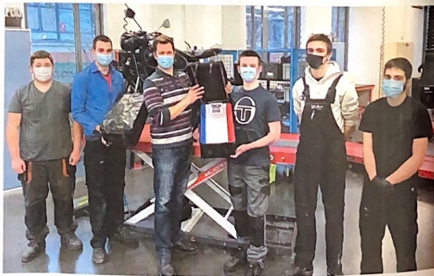
Réception de la nouvelle malle au lycée Gustave Eiffel le 12 janvier 2022. ▶